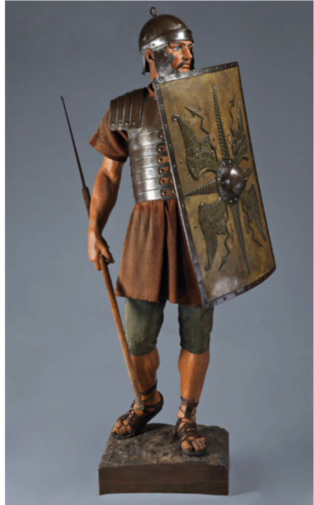
Légionnaire romain d'Auguste Bartholdi (Copyright MAN/Valorie Gô).